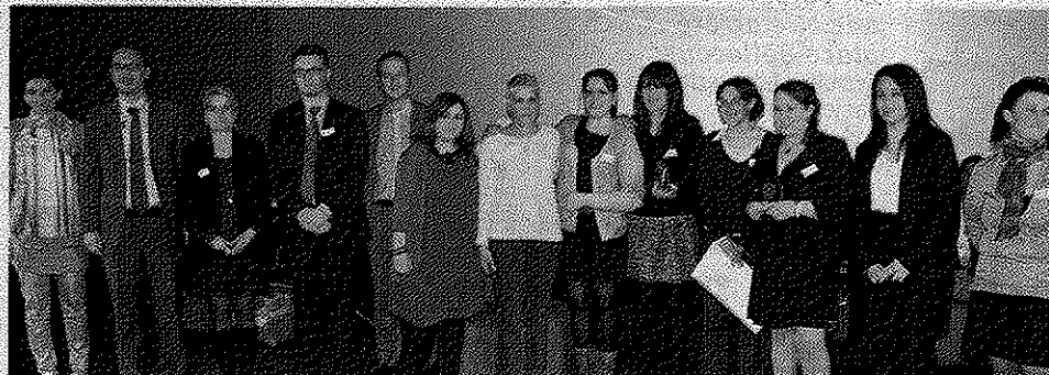
■ Les lauréates avec les partenaires et organisateurs.

C'est à l'UGC Lyon Confluence, devant plus de 200 personnes, que neuf salariées d'entreprises liées au service à la personne, ont reçu un trophée, en présence de Tabata Bonardi, chef cuisinier et finaliste Top Chef 2012, marraine de cette première édition. Le Sapra, association qui